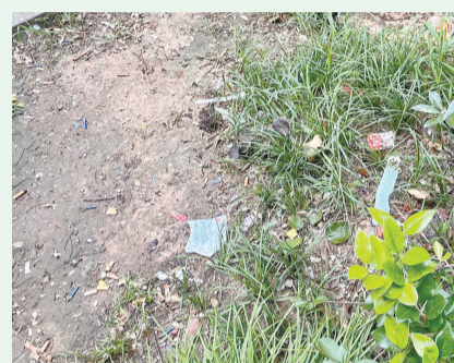
8月20日9:34 摄于澳门路中房花苑小区周边