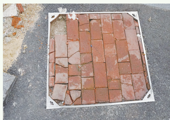
8月20日8:57摄于北京路农贸市场周边