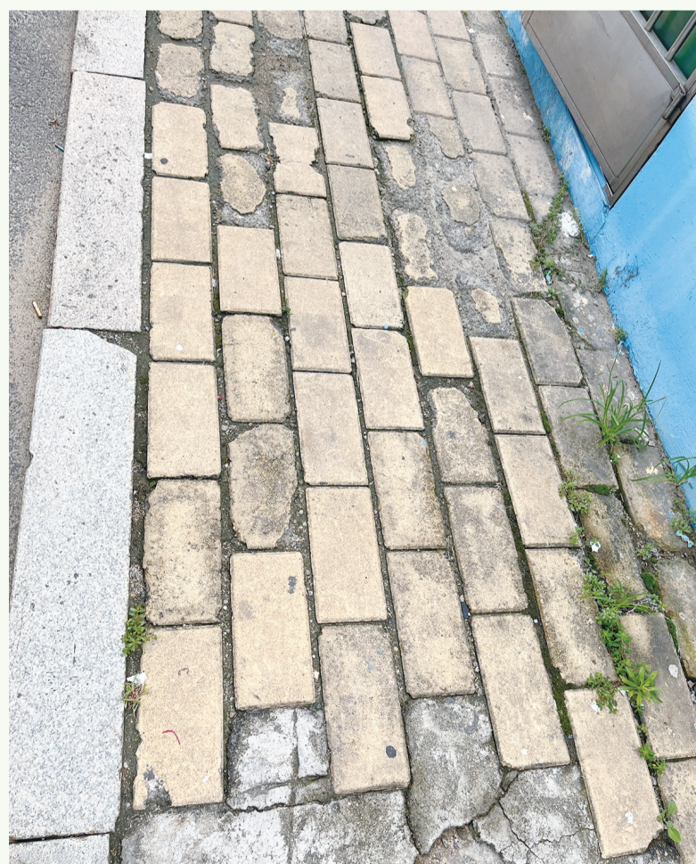
8月20日8:50摄于澳门路三里河社区服务中心周边