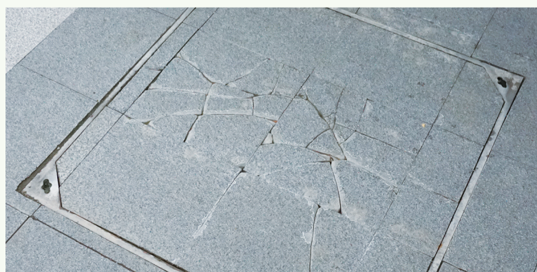
8月20日8:51摄于北京路农贸市场周边