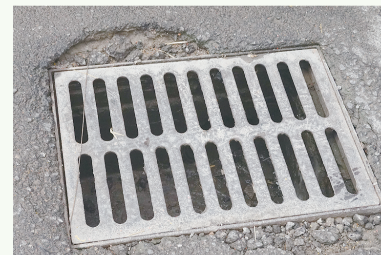
8月20日8:55摄于北京路农贸市场周边