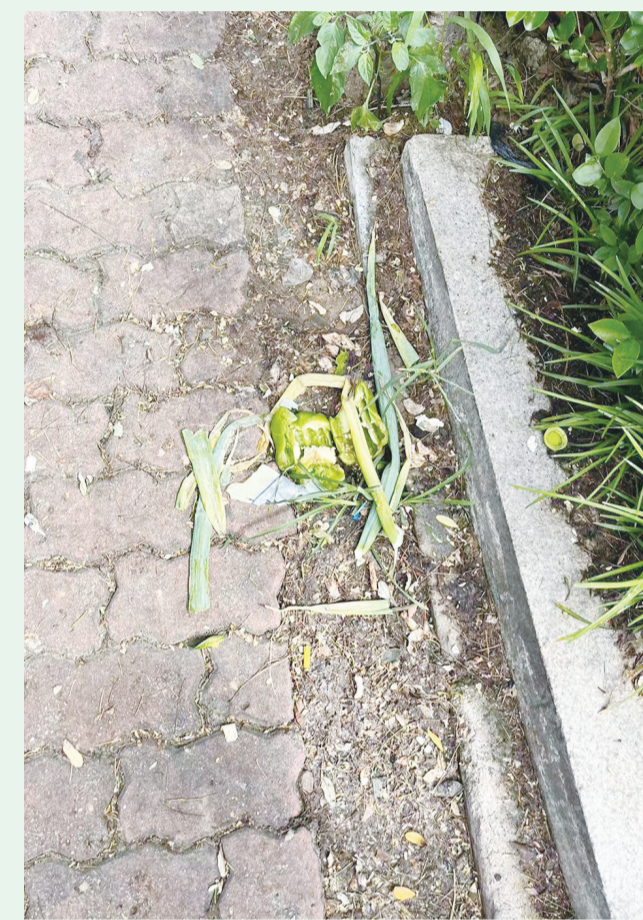
8月20日9:36摄于澳门路中房花苑小区周边