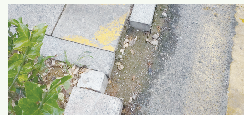
8月20日8:54摄于北京路农贸市场周边