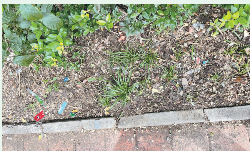
8月20日9:32摄于澳门路中房花苑小区周边