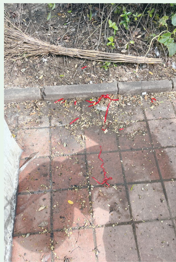
8月20日9:33摄于澳门路中房花苑小区周边