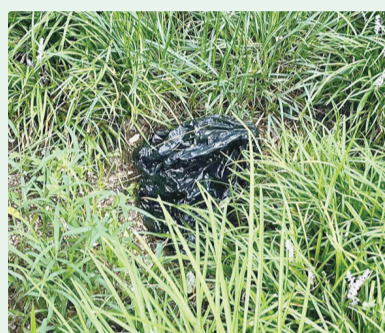
8月20日9:37 摄于澳门路中房花苑小区周边