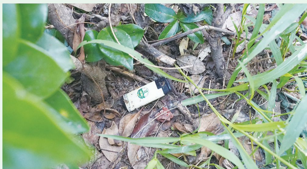
8月20日9:30摄于澳门路中房花苑小区周边