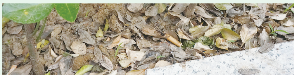
8月20日8:48摄于北京路农贸市场周边