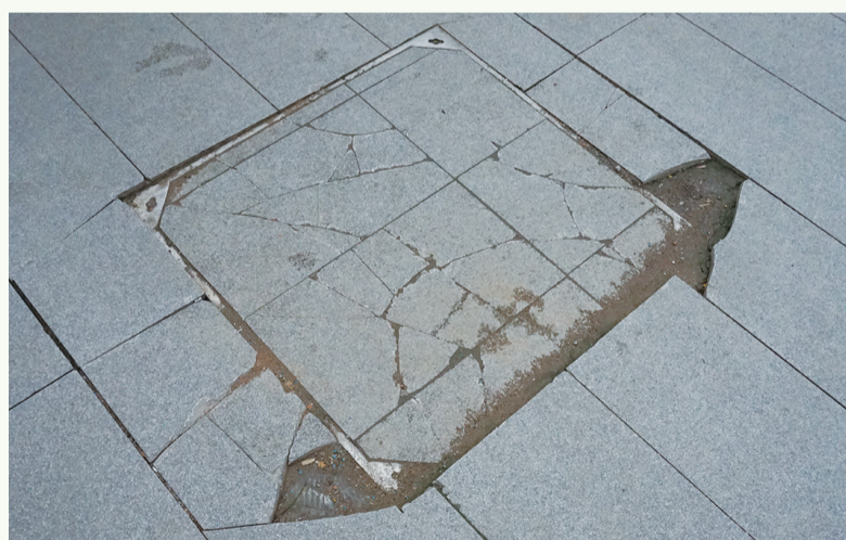
8月20日8:52摄于北京路农贸市场周边